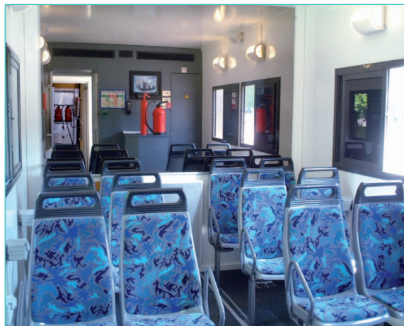
unité mobile de feu 12 places