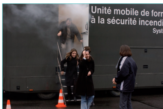
formation en situation réelle