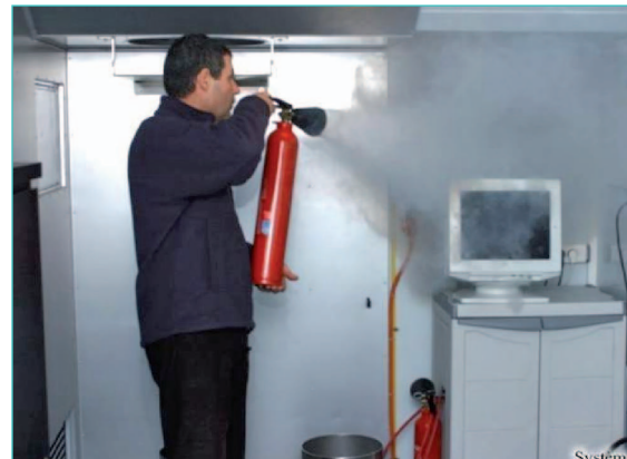
manipulation des extincteurs sur feu réel