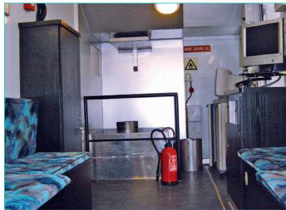
unité mobile de feu reprenant les conditions de travail